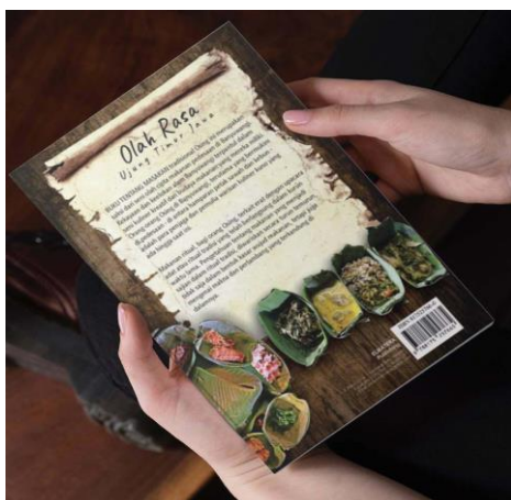
Gambar 3. Halaman belakang buku tentang makanan ritual

Pelaksanaan PKM ini, secara keseluruhan, merupakan bagian dari usaha preservasi dan revitalisasi tradisi memasak makanan ritual sebagai warisan budaya tak benda ( intangible cultural heritage ). Efektifitas solusi dan luaran PKM ini dapat diukur dari kondisi mitra sebelum dan sesudah pelaksanaan PKM yang dijabarkan dalam tabel 1 berikut ini.