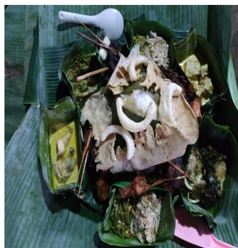
Gambar 1. Hidangan ritual Tumpeng Songo di dusun Andong-Desa Tamansuruh

Dari rangkuman seluruh permasalahan tersebut, maka pokok persoalan yang dihadapi komunitas etnik Osing, utamanya bagi mitra adalah dari aspek strategi dan model preservasi seni tradisi olah cipta makanan ritual. Untuk itulah rencana kegiatan yang diusulkan dalam pelaksanaan program PKM ini lebih menekankan pada usaha preservasi seni tradisi olah cipta makanan ritual melalui penyusunan materi/ buku seni tradisi olah cipta makanan ritual disertai dokumentasi digital dan pelatihan pembuatan makanan ritual bagi kaum muda Osing, sebagai bagian dari salah satu materi rintisan sekolah adat.